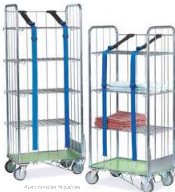
Avec sangles réglables et étagères (options).