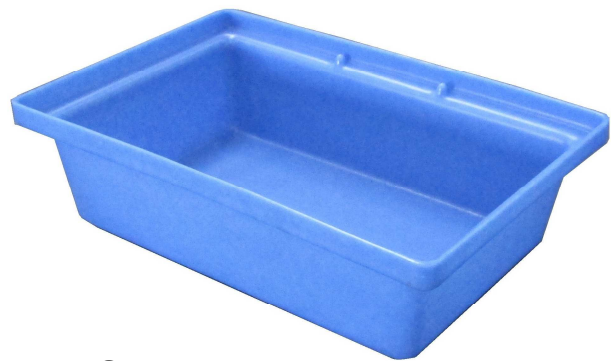
ST20AB (sans caillebotis)